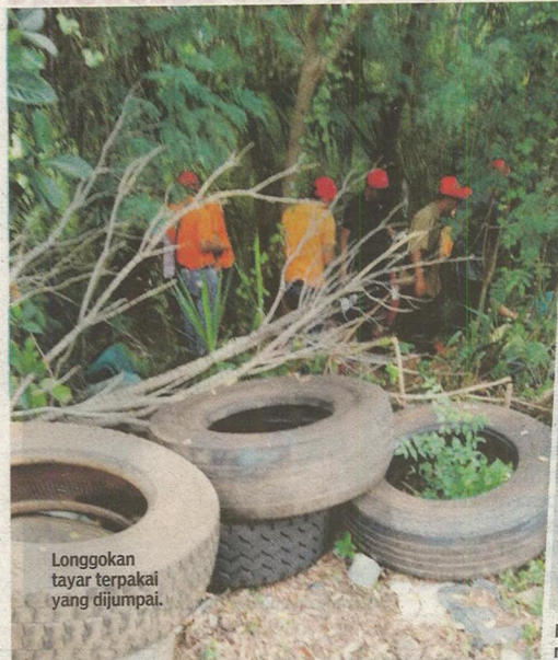
Longgokan tayar terpakai yang dijumpai.

"Saya percaya, komitmen ini membuktikan kita sudah bersedia menghadapi gelombang trend kenaikan kes denggi yang dijangka akan berlaku pada hujung tahun ini," katanya.