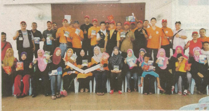
Sebahagian Komuniti Combi Pangsapuri Impian Bandar Saujana Putra.