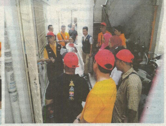
Edaran risalah denggi dan abate kepada penduduk.