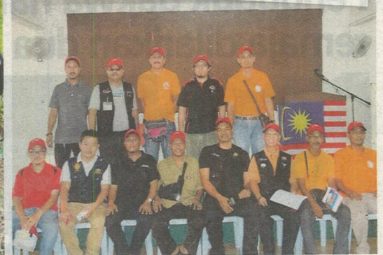
Wakil Combi SP4, Combi BDP, Combi Persatuan Anak-Anak Pantai Timur (Peranti), KRT Fasa Rumah Pangsa Impian dan Jawatankuasa Majlis Bertindak yang terlibat program dijalankan.