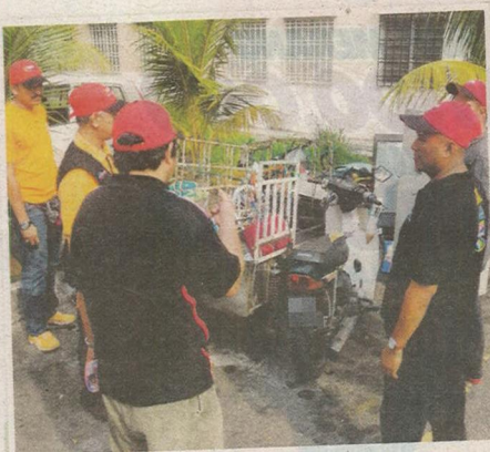
Penemuan barang terpakai yang berisiko tinggi menjadi tempat pembiakan aedes.