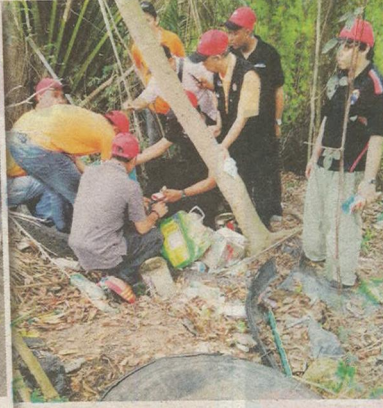
Sebahagian komuniti Combi menemui lokasi pembiakan aedes.